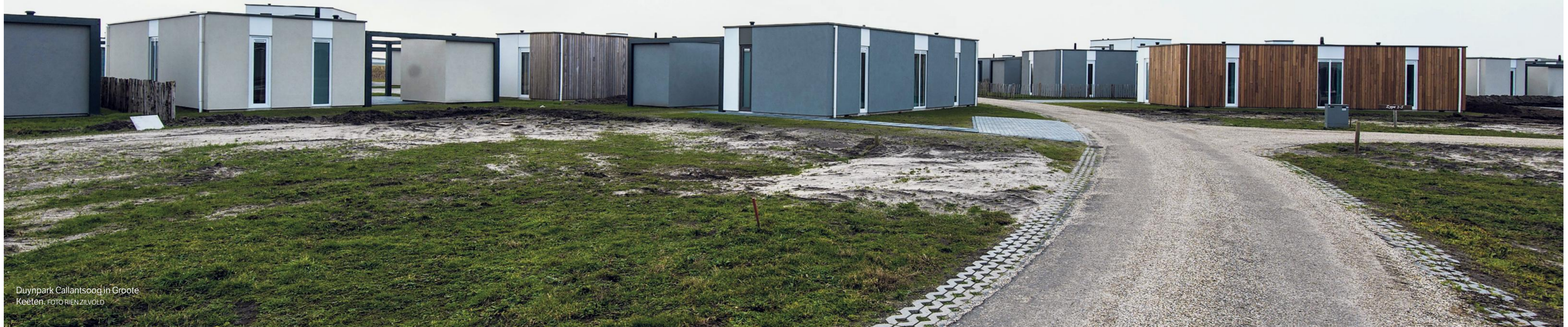
Duynpark Callantssoog in Grootte Keeten.

Hier wil ik blijven wonen Hier voel ik mij echt thuis. En nee... ik wil geen strandhuis... Wonen doe je op het land. Tot rust komen, dat doe je... Op een ongerept, leeg strand!